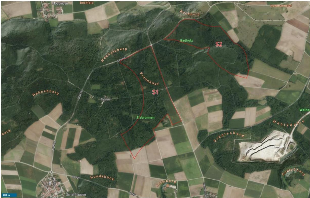
Abb. 2: Lage der Sonderbauflächen

Grundsätzlich wird in den vorliegenden Planunterlagen von „voraussichtlich 6 Windenergieanlagen“ ausgegangen, die „mindestens eine Höhe von 100 m“ haben werden. Für die geplanten Sonderbauflächen soll die sog. „Rotor-out-Regelung“ gelten, d.h. dass nur der Turmfuß innerhalb der ausgewiesenen Gebiete liegen muss. Die Rotorblätter dürfen hingegen in den Luftraum außerhalb der Gebietsgrenzen ragen. Bei einer immissionsschutzrechtlichen Voranfrage betrug die größte Gesamtanlagenhöhe 261 m. Genauere Angaben sind den Planunterlagen nicht zu entnehmen. Auf Nachfrage wurden die in der Voranfrage angegebenen Höhen bestätigt (Anlagenhöhen von 223 m bis 261 m).